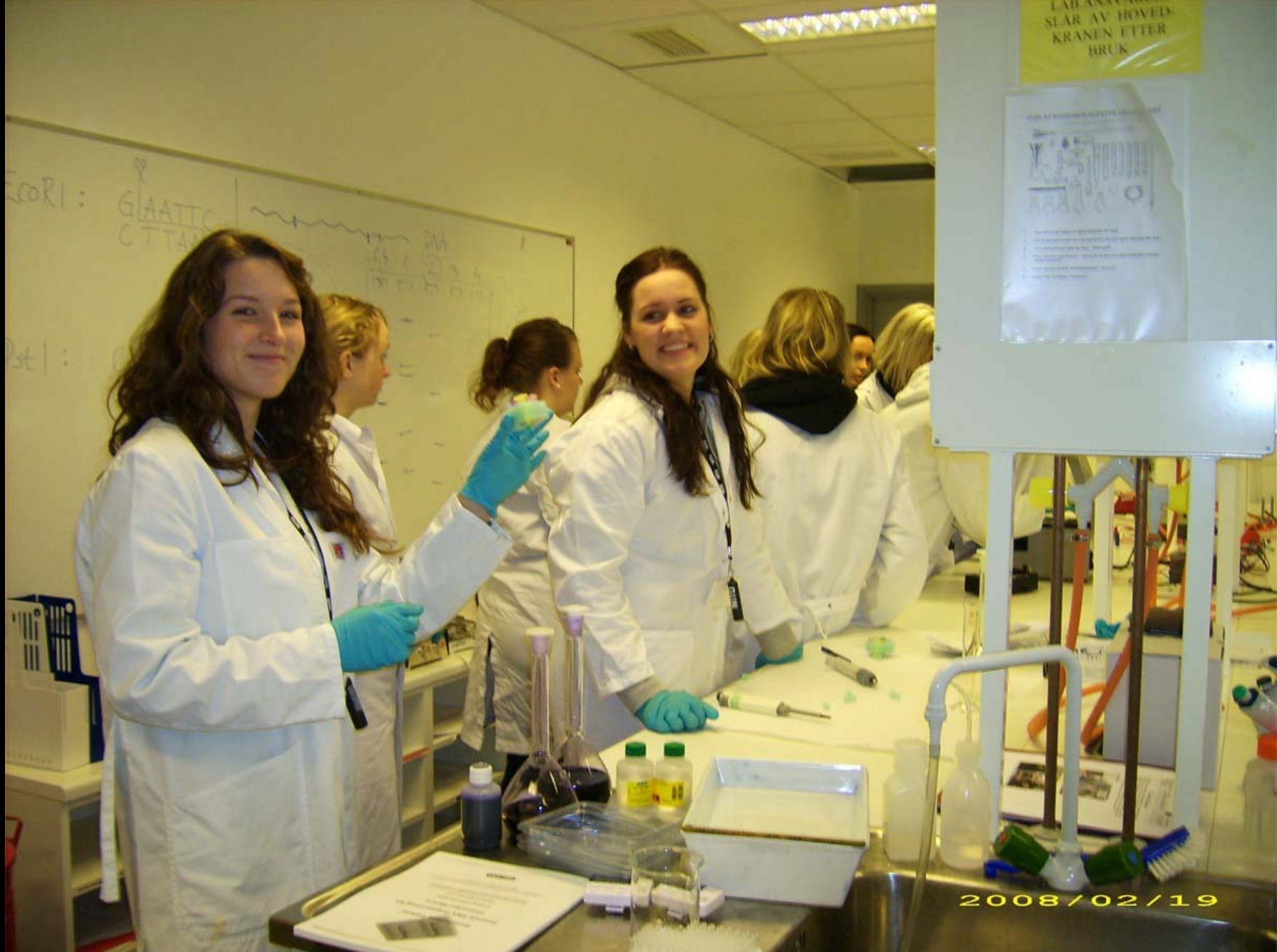
Biologi2-elevar i aksjon